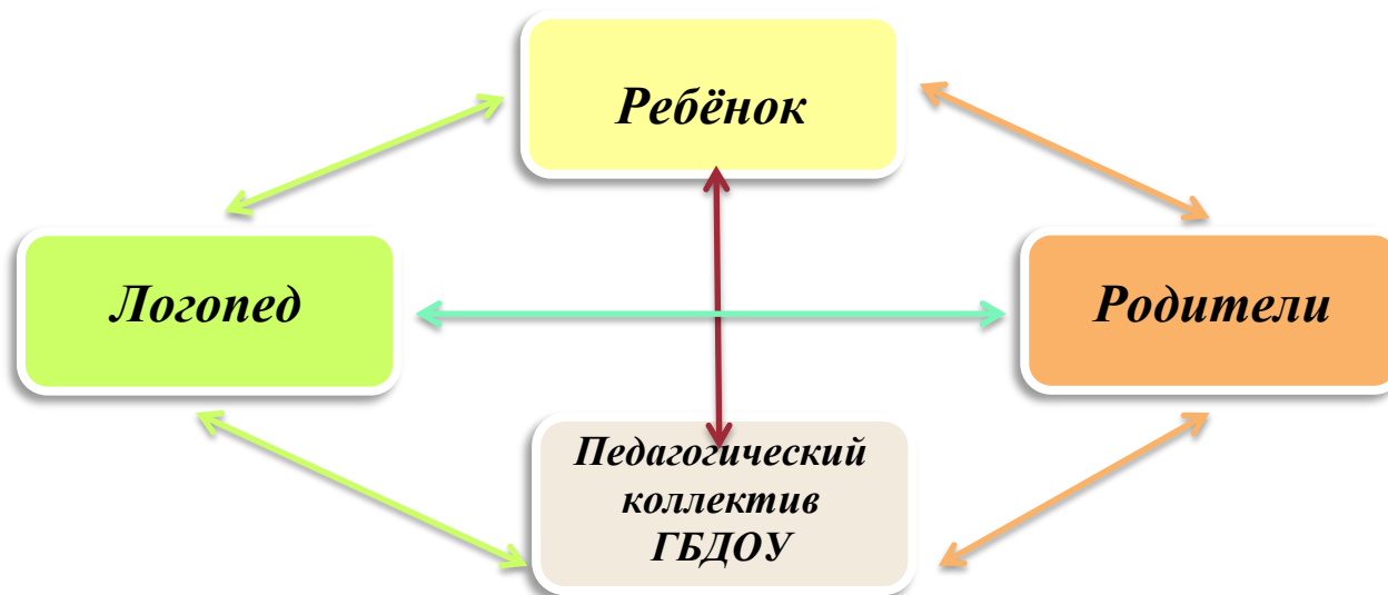
Рис.1. Модель взаимодействия субъектов коррекционно-образовательного процесса в группе для детей с общим недоразвитием речи

Необходимость учета обозначенных принципов очевидна, поскольку они дают возможность обеспечить целостность, последовательность и преемственность задач и содержания обучающей и развивающей деятельности. Кроме того, их учет позволяет обеспечить комплексный подход к устранению у ребенка общего недоразвития речи, поскольку таким образом объединяются усилия педагогов разного профиля – логопеда, воспитателя, музыкального руководителя, инструктора по физической культуре и др. (рисунк 1).